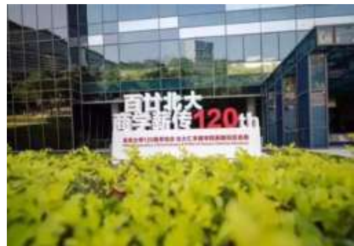
北京大学汇丰商学院

作为目前英国校区的主要建设者，北京大学汇丰商学院一直是北大创建世界一流大学和“双一流”建设的重要组成部分。北大汇丰的规划是，到 2024 年学院建院 20 周年时，基本建成一个中国顶尖、国际知名、若干领域达到世界一流的商学院。