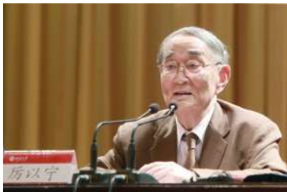
厉以宁主讲名师大讲堂第一讲：国家富强 与人民富裕

2014年下半年，为落实深入贯彻中央的把社会主义核心价值观纳入教育教学系统的要求，北大开设了社会主义核心价值观“名师大讲堂”，聘请厉以宁、梁柱、朱苏力、潘维、韩毓海、程郁缀、孙熙国、钱乘旦、楼宇烈、李伯谦、袁明、于鸿君等12位知名专家教授围绕社会主义核心价值观的12个关键词进行解读。