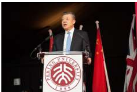
中国驻英国大使刘晓明在启动仪式上致辞