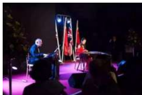
英国校区校庆文艺演出现场

庆典期间，还举办了学生和校友的校庆文艺演出、“百廿北大·商学薪传——北京大学 120 周年校庆暨北京大学汇丰商学院英国校区启动特展”等活动。