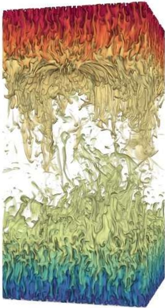
流动结构在竖直方向呈现皆然不同的三层结构

模拟再现了热带海洋中的一种多层流动结构，如下图所示：流动结构在竖直方向呈现皆然不同的三层结构。