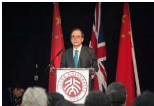
北大校长林建华在启动仪式上致辞

北京大学林建华校长在启动仪式上指出，北大要“守正”，遵循高等教育发展规律，坚守传统，重塑公信与尊严；北大还要“创新”，要与时俱进，全面深化综合改革，始终保持“敢为天下先”的勇气和魄力；要“引领未来”，要把每个机构、每个人的创造潜力都激发出来，培养能够引领未来的人，产生影响国家和人类进步的新思想、前沿科学和未来技术。