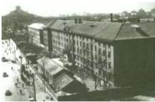
红楼——北京大学原校址

中国高等教育的标杆，扎根中国大地，在实现内涵式发展、建设世界一流大学和一流学科征程上迈出更加坚实的步伐，让前辈先贤的宏伟志向在我们这一代人手中早日实现。