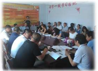
北京大学项目组对地方进行调研