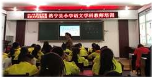
河南洛宁县小学语文送教专场

北京大学承办了 2016 年“国培计划”——河南省中小学教师网络研修项目，并在 2017 年 3 月 12 日至 24 日期间，派工作组分赴所对接的十个项目县进行线下研修活动，在十个县（市）相关教育部门的帮助和支持下，圆满完成送教下乡的任务。此次送教活动持续时间长、参训教师覆盖面广、涉及学科多、课程形式丰富。对于北京大学国培项目组来说，顺利完成这项活动，积攒了不少经验，同时也发现了当中存在的问题。